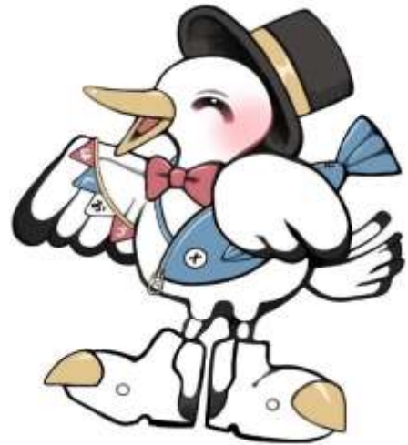
白鷗祭公式マスコットキャラクター 「はっくー」

第50回白鷗祭では、マスコットキャラクターを製作することが決定しました。本キャラクターは白鷗大学のカモメをモチーフにし、第50回記念の華やかなイメージと第50回まで白鷗祭を続けられていることに対する感謝と祝福の気持ちが込められています。